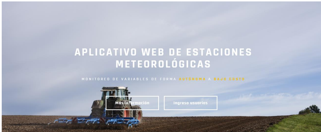
Figura 1 Banner inicial de la página

Seguido de esto, se puede observar una sección dónde se muestran las tres principales características que hacen diferente de los demás a nuestro sistema. Debajo de esta sección, un botón de redirección hacia dónde se encuentra un formulario de contacto, en el que un nuevo usuario puede registrarse ingresando sus datos y un mensaje.